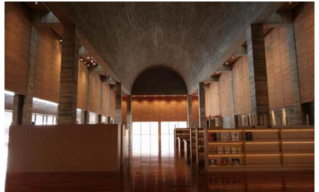
島根県立石見美術館ロビー